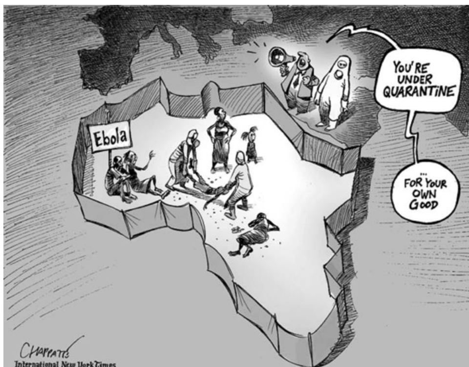
Figura 1 – Lidando con el ébola 31

Traducción: [Ébola] [Están en cuarentena] [...por su propio bien]