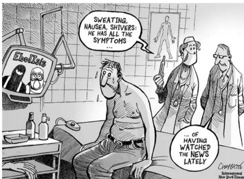
Figura 2 – ¿Será que tiene ébola? 32

Traducción: [Sudores, náusea, temblores: tiene todos los síntomas...] [...de haber estado viendo las noticias últimamente]